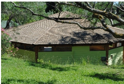
Tanzhaus – Oktagon

Arillas besitzt einen der schönsten Sandstrände Korfus und ist zu Fuß vom Zentrum aus in 15 min. zu erreichen. Das Wasser ist klar und sauber und lädt zum Baden und Schwimmen ein.